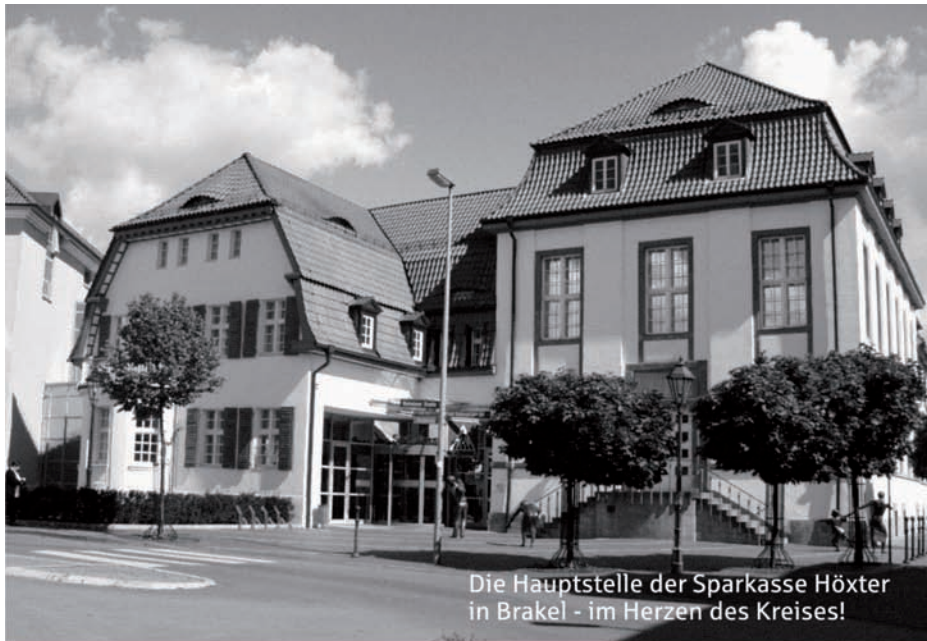
Die Hauptstelle der Sparkasse Höxter in Brakel - im Herzen des Kreises!